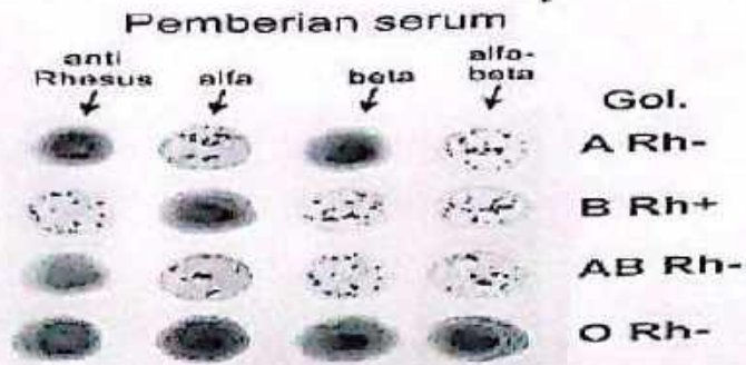
Tabel hasil pengamatan :