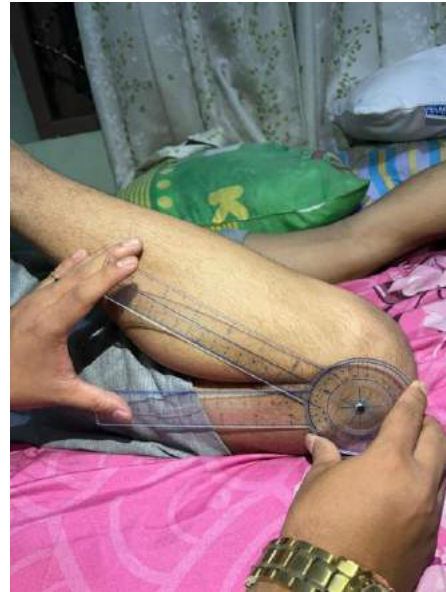
FLEKSI KNEE 115