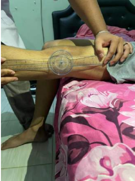
EKSTENSI KNEE 0