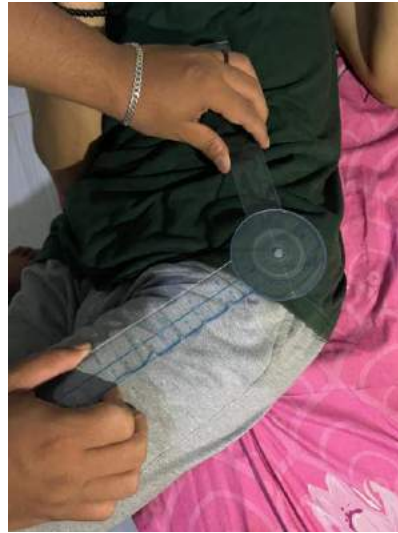
ABDUKSI HIP 60