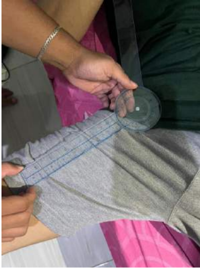
ADDUKSI HIP 70