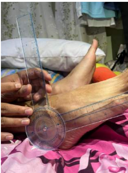
PLANTAR FLEKSI 80