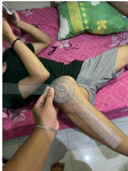
EKSTERNAL ROTASI 40