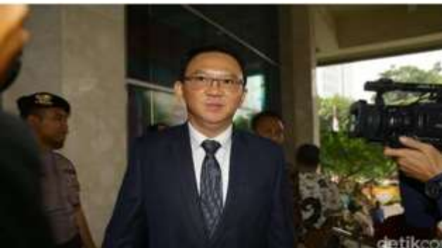
Mantan Gubernur DKI Jakarta Basuki Tjahaja Purnama (Ahok).

Jakarta - Mantan Gubernur DKI Jakarta, Basuki Tjahaja Purnama (Ahok), menyebut ada keuntungan dari sistem e-budgeting yang