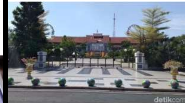
Balai Kota Surabaya

Surabaya - Untuk meminimalisir mark up dan mencegah korupsi dalam pengelolaan keuangan daerah, Pemkot Surabaya menggunakan e-budgeting sejak 2003. Selain e-budgeting, ada banyak sistem elektronik lainnya yang digunakan pemkot seperti e-